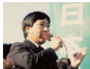
1993年、衆議院議員選挙に 日本新党より立候補し、初当選