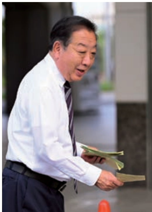
2024年、初めて街頭に立ち始めてから38年 いまま変わらず街頭活動はつづいている