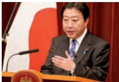
2011年11月、首相官邸にて