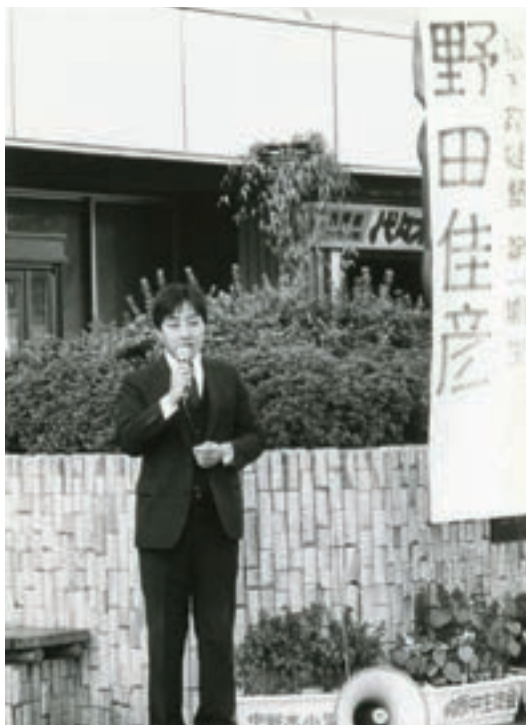
1986年、街頭に立ち始めた頃 傍らのノボリ旗は友人が手書きしてくれたもの