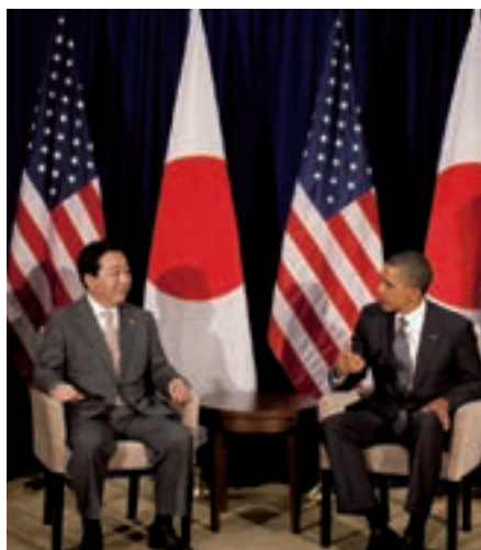
2011年11月、APECでオバマ大統領と

38年にわたり、駅頭や集会でお聞きした国民の声を結集し、日本の政治改革、世界の平和に真剣に取り組んできました。