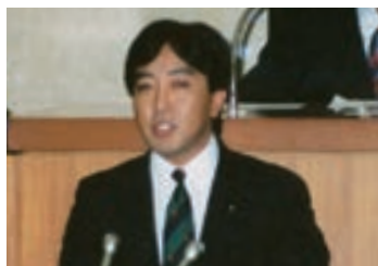
1987年、千葉県議会にて その後、千葉県議を2期務めた